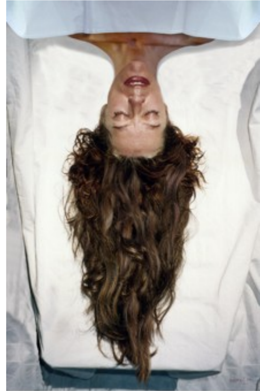
Autorretrato Julio 2000