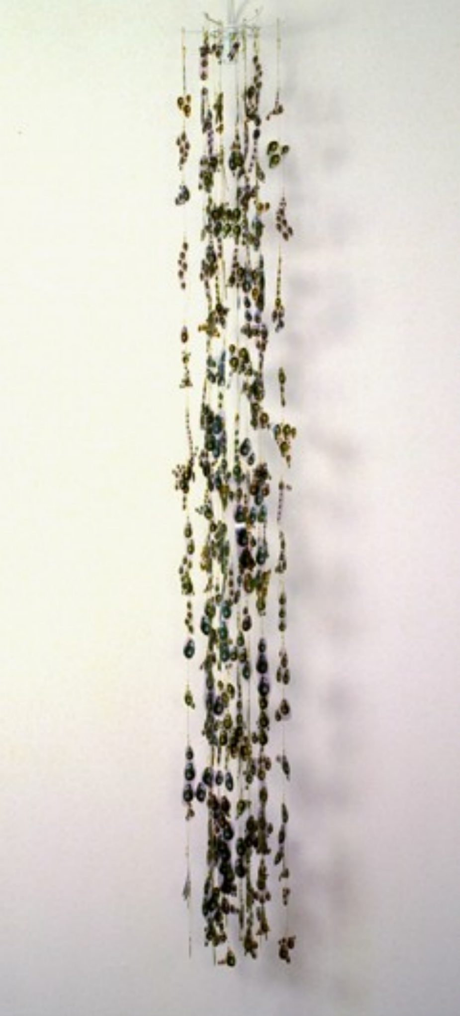
Rosario de iris 1996 escultura 250 x 30 x 30 cm 240 Cibatrans en 15 hileras útiles de pesca imperdibles estructura metálica