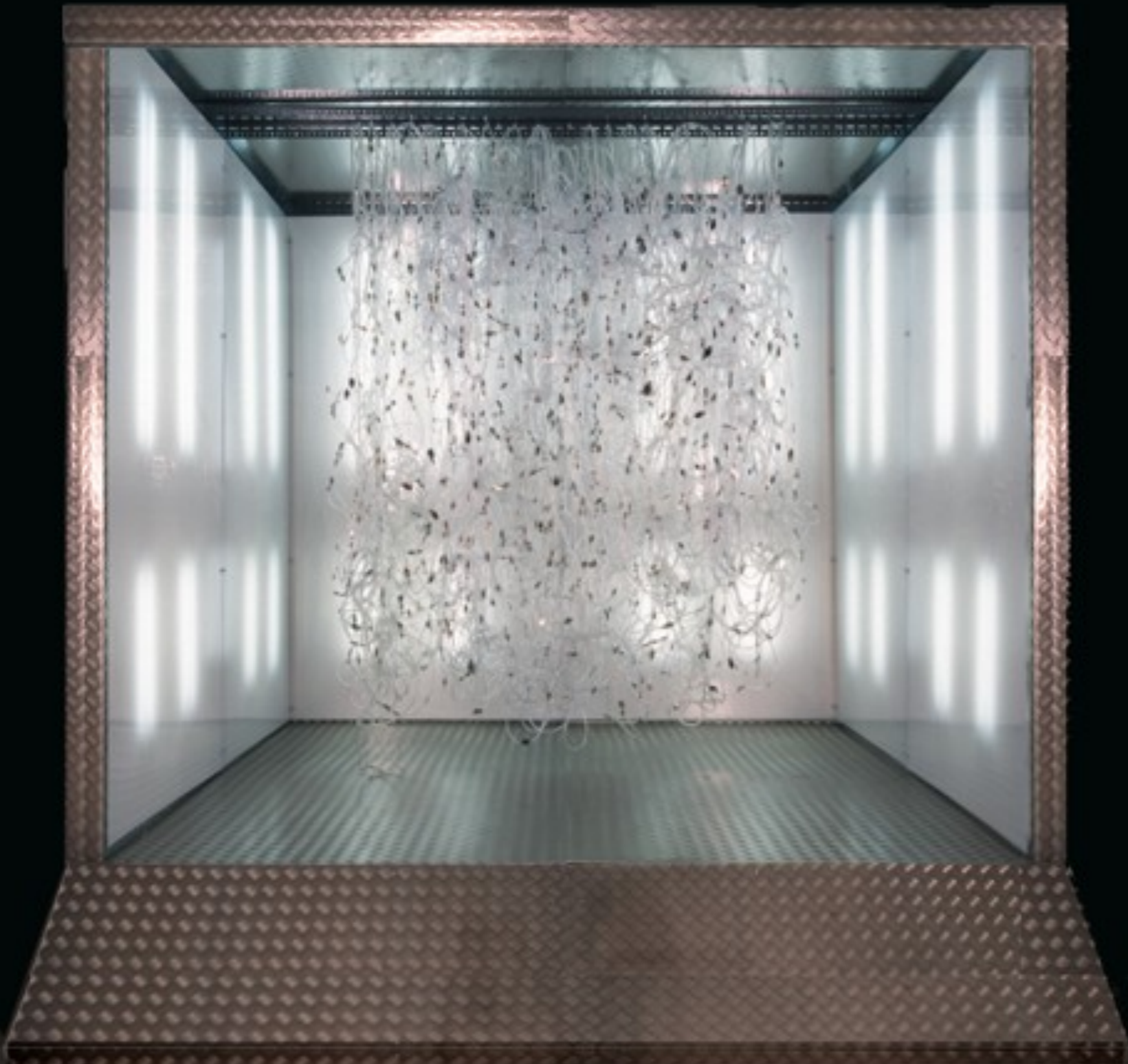
Cánulas de riego

1996-2003 instalación de fotografía y luz 350 x 350 x 450 cm Cibatrans, cánulas, fluorescentes, contenedor de chapa, perfiles perforados